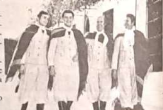
Los Tucu Tucu.

co-animadora del estelar folclórico de Televisión Nacional, "Canta Chile", que se inicia con la presencia del conjunto argentino Los Tucu Tucu.